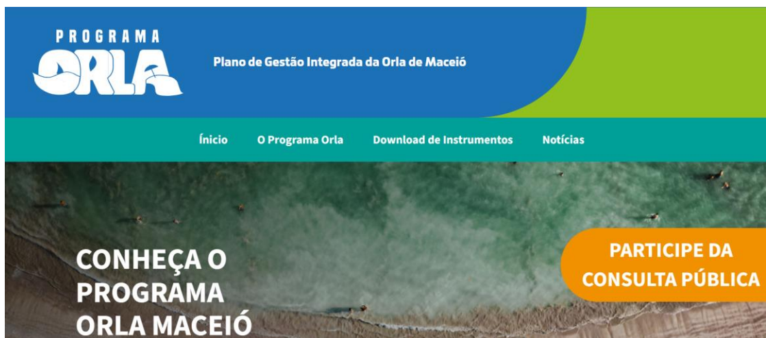
Figura 5: página eletrônica do Programa Orla no site da Prefeitura de Maceió.