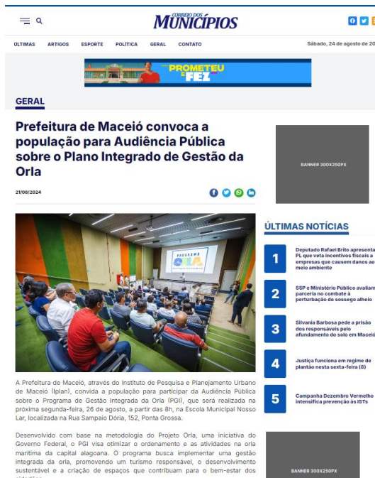
Figura 3: matéria de divulgação da audiência pública no portal Correio dos Municípios AL.