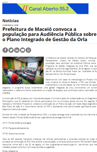
Figura 1: matéria de divulgação da audiência pública no portal AL1